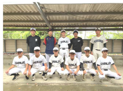
SHINJOアミーゴの皆さん 優勝おめでとうございます！

8月14日(月)「第72回新庄職域・地域盆野球大会」を開催しました。台風が迫る悪天候の中でしたが、無事に最後まで試合を行うことができました。参加いただいた選手の皆様、御協力いただいた皆様、ありがとうございました。