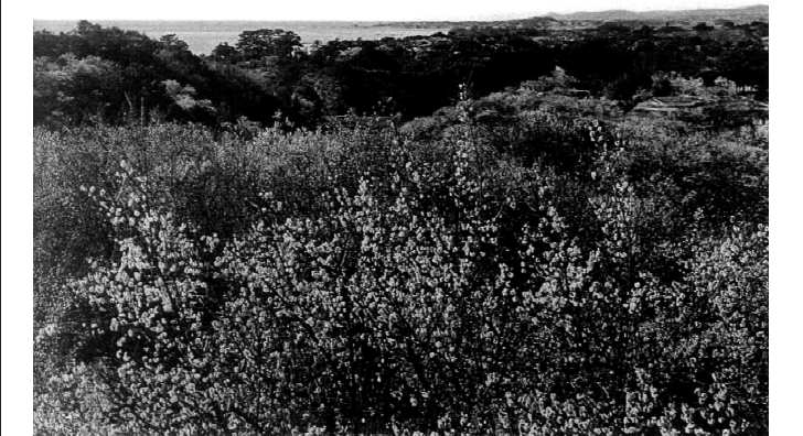
昭和初期の写真。梅の木々の隙間から白浜の番所山や田辺湾が一望できる素晴らしい景色だったそうです。