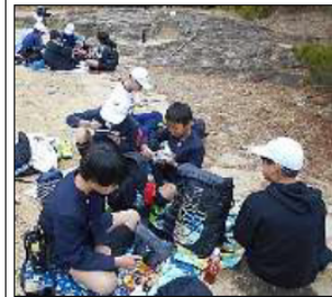
【待ってました、お弁当の時間！】

延期となっていた6年生の高尾山登山が1月19日(金)に実施することができました。往路途中で学校林(※)に立ち寄り測定を行ってから頂上まで登りました。復路は経塚に行って少しだけ地域の勉強もしました。前夜から雨が降っており朝にはやんでいましたが曇天だったので出発を1時間ずらしました。おかげで山を下りる頃には太陽が出て暖かったです。