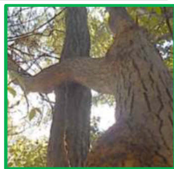
【まだまだ高尾山には「不思議」がありそう】

右の写真が明確に見えていけばいいのですが、解説すると手前(右)の木の枝が奥の木(左)の幹に食い込み左に伸びています。奥の木からすると啜え込んでいるように見えます。登山中に見つけたのですがしばらくの間立ち止まって見とれて