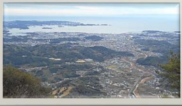
【高尾山から田辺湾を望む】

田辺市立上秋津小学校 令和6年2月1日(木) No. 236 文責: 木村 誠 TEL 35-0014