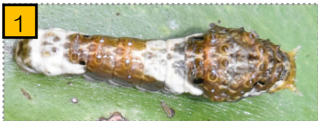
写真1～4はクロアゲハの幼虫です。写真1は4齢幼虫ですが、1～4齢は白と濃い茶色の模様をしています。これは鳥の糞に擬態しているからだと言われます。糞を食べたい鳥は少ないでしょうから。写真2は4齢幼虫が脱皮して終齢幼虫になったところです。脱皮殻が横にあります。写真3は終齢幼虫で緑色に黒い帯があります。側面にある黒い目玉模様は眼ではありません。写真4は終齢幼虫が頭部と胸部の間にある「臭角(しゅうかく)」と呼ばれる角を伸ばしたところです。臭角は二股に分かれていてミカンから得たテルペノイドを主成分とする強烈なおい物質を放出します。これは敵に対する防衛のためであると言われています。臭角は他の齢にもあり通常体内に収納されています。クロアゲハ以外のアゲハ蝶の幼虫も姿・性質ともほぼ同様です。写真は昨年(2023年)の10月に我が家の庭に生えているミカンで撮影しました。