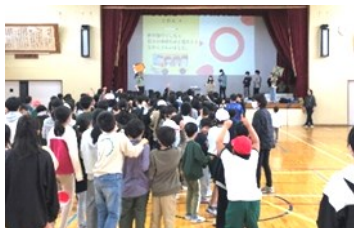
↑全校で盛り上がった「6年生を送る会」

2月20日(火)には、全校で「6年生を送る会」を行いました。間もなく巣立ってゆく6年生と楽しい思い出を残すために、また、これまでお世話になったことへの感謝を伝えるために、他の学年がゲームやプレゼントを用意しました。6年生は、「とても楽しかった。私たちのために準備してくれてうれしかった。」や「5年生は次の最高学年として、ゲームの準備やあいさつをして、下の学年を引っ張っている姿がすごくかっこよかった。」などの振り返りを書き残していました。