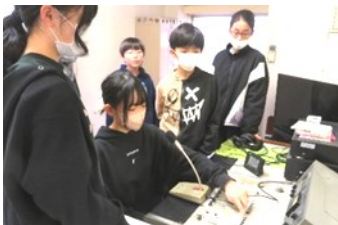
↑先輩から委員会の仕事を引き継ぐ

2月21日(水)には、新委員会が活動を開始。通常は5・6年生による活動ですが、来年度につなぐため今回からは4年生が加わっています。放送委員会では、6年生からの手ほどきを受けながら、新メンバーが放送の練習を行いました。テスト放送を終えた児童は、「6年生が優しく教えてくれて分かりやすかった。」「みんなに聞こえやすいように、明るい声で放送したい。」と感想を聞かせてくれました。