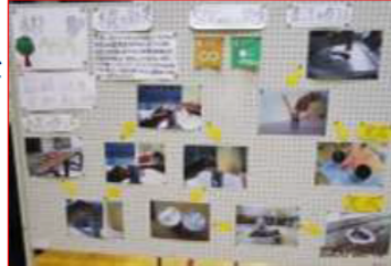
【6年〈再発見！私たちの上秋津〉 「木材再利用」班】

総合的な学習や生活科を中心に農業体験学習などの様々な活動を通してSDGsのつながりに気づき、自分たちができることを考え行動につなげる。