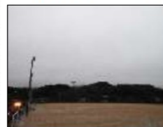
【この日は高尾山がかくれんぼ】

また1つ上秋津小学校の自慢を見つけました。2月20日朝、霧が立ちこめる湿気の多い日でした。窓ガラスは曇って向こうが見えない状態なのに床や壁は全く結露になっていません。水が浮いていないのです。木のありがたさをあらためて感じました。