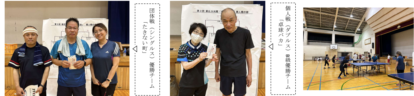
団体戦(シングルス) 優勝チーム 「たきない町」