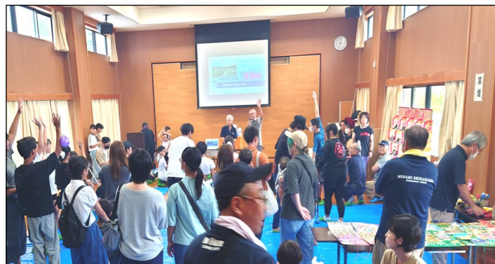
文化委員会による三栖の解説の様子(写真左上)。

衣笠中学校、町内会、婦人会の皆さま運営お疲れさまでした。そして、興味を持って会場に遊びに来ていただいた地域の皆さまにも感謝申し上げます。