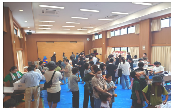
お祭り開始数分後の様子(右上)。