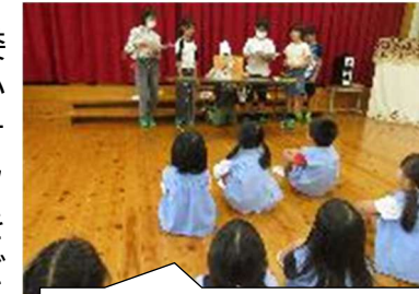
紙芝居「けーきだほいほい」

10月10日(木)に、中芳養小学校の図書委員さん、6名が来てくれ、紙芝居の読み聞かせをしてくださいました。動物のお面やコックさんの帽子を身につけ、登場してくるキャラクターにそれぞれがなりきって、読み聞かせをしてくださいました。楽しい紙芝居のお話に子どもたちは喜んで聞くことができました。