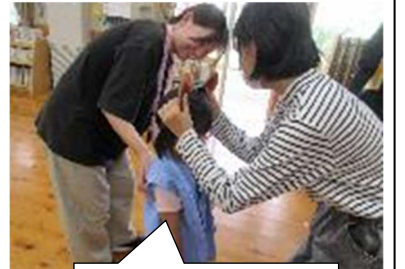
動物のお面で変身!

その後はお面や帽子を被らせてもらい、「せっかくだから、幼稚園の子どもたちにあげるよ」とプレゼントしてもらいました。前期の図書委員さん、ありがとうございました。