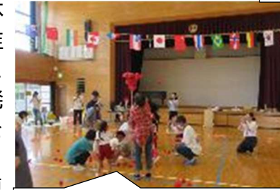
祖父母の方、芳寿会の方との玉入れ