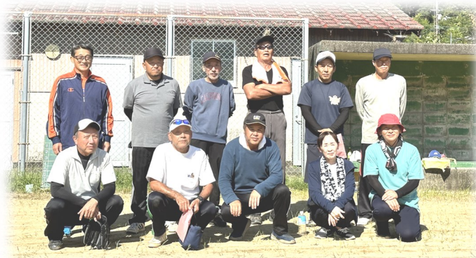
準優勝：宮代・中山路