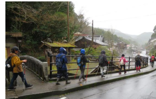
多くの旅人を癒してきた湯の峰の温泉街に到着

懸命に歩みを進めた一同は短時間でお昼休憩を済ませたのち、なべわれ地蔵を通り過ぎ、柿原茶屋跡を見学し、ゴールを目指して歩き続けました。