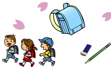
学校別 児童・生徒数(4月1日現在)