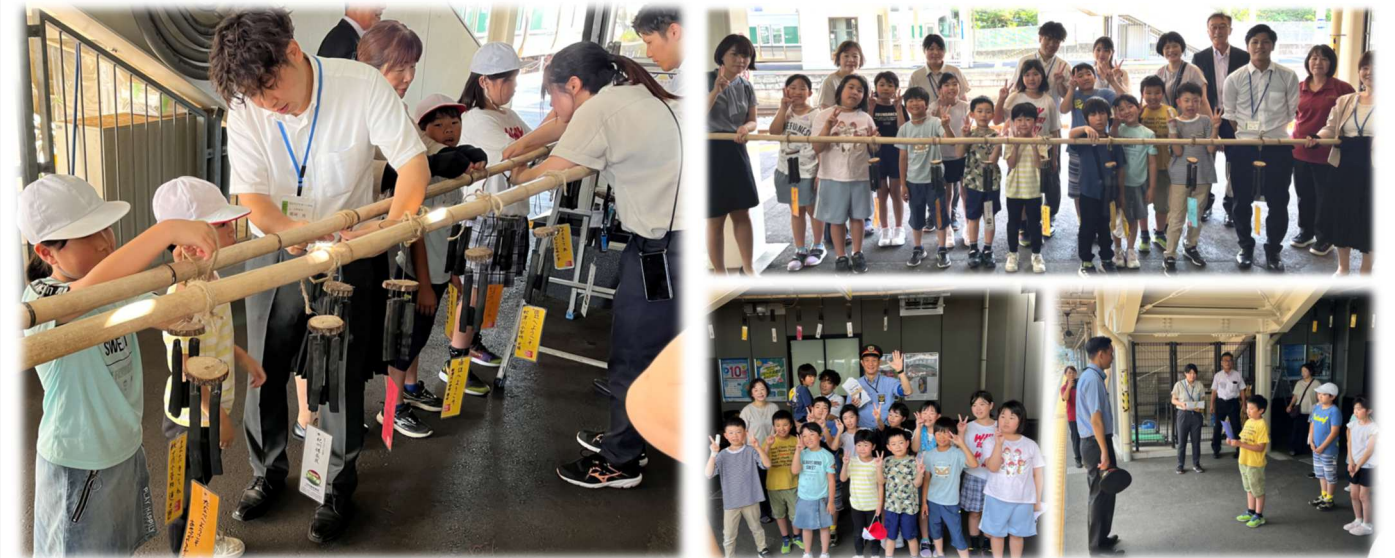
△紀伊田辺駅構内での飾りつけの様子

7月8日（月）、秋津川振興会を中心に、紀州備長炭の情報発信及び伝承活動の一環として、紀伊田辺駅構内及び田辺市役所3階正面玄関に、秋津川小学校児童が作成した紀州備長炭風鈴を飾らせていただきました！