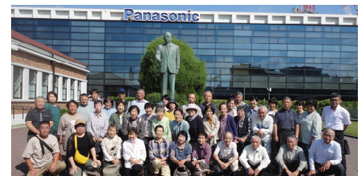
2023年 パナソニックミュージアムにて

そして、和歌山県36番目の道の駅として令和5年秋オープンの『海南サクアス』では、「産直マルシェ」「魚盛水産」「シモツフルーツ」などをお楽しみください。