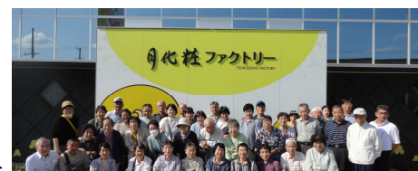
2023年 月化粧ファクトリーにて