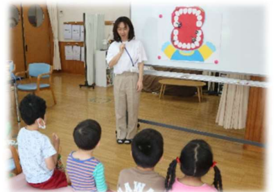
小学校の保健室で歯磨きの練習

2学期には、上秋津中学校2年生の職場体験学習や3年生の家庭科のふれあい体験学習を通して交流を行います。