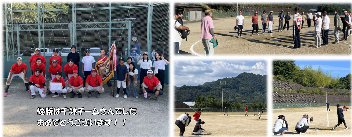
優勝は千鉢チームさんでした。 おめでとうございます！！

また、本大会でホームラン賞及びランニングホームラン賞も出ました！誠におめでとうございます！