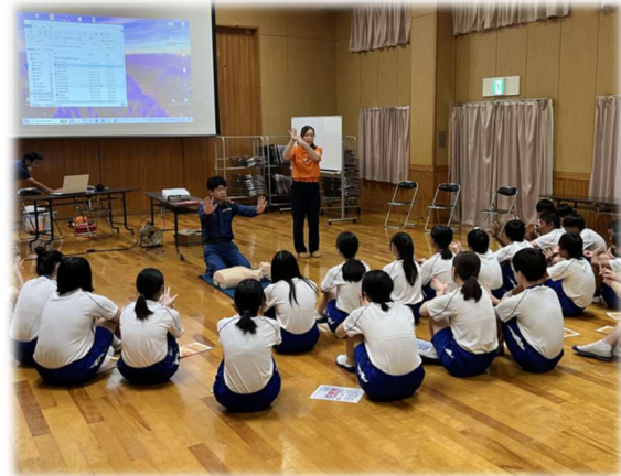
△ 消防署職員さんからの説明

講師の方から、救急救命における一時救命処置の大切さ、そばに居合わせた人が早い段階で処置をすればするほど、その人の救命の可能性は高くなることなどをお話いただきました。