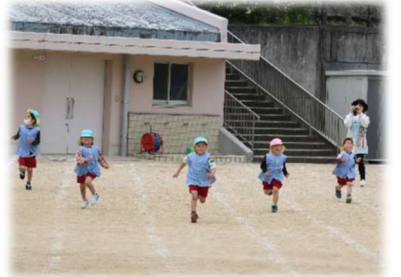
小学校の運動場で50m走に挑戦