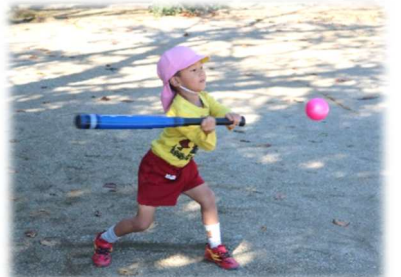
野球のバッティングに挑戦