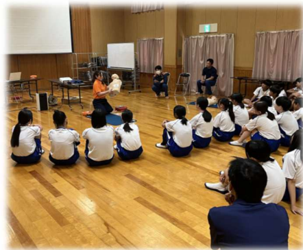
△ AEDの使用方法的説明