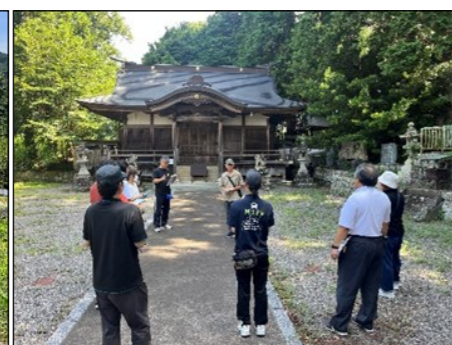
珠簾神社。読みは“みす”である。三栖小学校の児童にとっては相撲大会で関わりが深い。