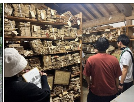
小学校横の調理場の裏手にある文書庫の2階。4000冊ほどの文書が収まっている。