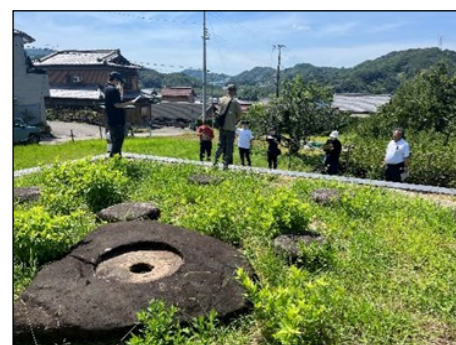
三栖廃寺。写真内左手前が、7世紀後半頃に建てられたといわれている七堂伽藍の塔基壇部。