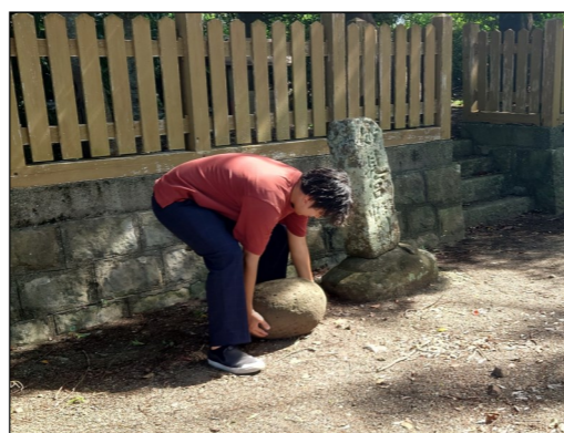
妙見神社の境内にある力石を持ち上げようとする様子。子ども達も毎年チャレンジします。

これからも、本校の教職員が地域のよさを知ったり、地域との繋がりを大切にしたりしながら子どもたちへの指導にあたっていきたいと考えています。