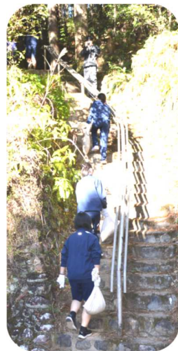
土嚢袋を持ち階段を往復する生徒たち

12月4日（水）本宮中学校全校生徒が「熊野古道環境保全活動」として熊野古道中辺路ルートの中軒茶屋近くで道普請を実施しました。この活動は、雨などにより流失した土を補充・補修することにより、本宮へ訪れた方々が歩きやすくなるように整備するものです。熊野古道が世界遺産として登録される前から三里中学校が取り組んでいた活動を学校統合後の本宮中学校が引き継ぎ、毎年12月に熊野本宮語り部の会と地域支援者の共同作業として実施しています。中学生は用意した2トンのまさ土を土嚢袋に入れて、元気よく軽い足取りで次から次へと古道に運び入れ、補修作業に精を出していました。学校と行政が一体となり、また、熊野本宮語り部の会の方々、地域の方々のご協力をいただきながら、地元の財産である世界遺産熊野古道を保全し守り続けることで、皆さんのおもてなしの気持ちが訪れる方に伝わっています。熊野の森の番人としてこの活動を後世へと引き継ぎ続けていただきたいと思います。