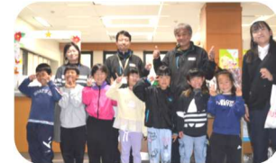
教育事務所で記念撮影