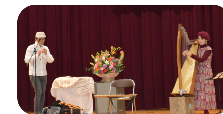
コンサートの様子