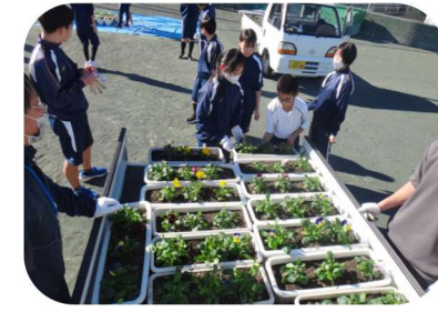
積み込み作業（昨年の様子）