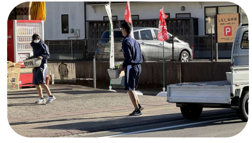
プランター配布（昨年の様子）