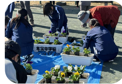
花植え作業（昨年の様子）

この度、公益社団法人食品容器環境美化協会が主催する「第25回環境美化教育優良校等表彰事業」の最優秀校4校に本宮中学校が選ばれ、特別賞 協会会長賞を受賞しました。これは、地域社会と連携しながら継続的に環境美化に取り組む全国の小・中学校を表彰するもので、これまでの学社融合の花配り等の取り組みが評価されたものです。おめでとうございます。