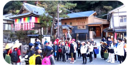
湯の峰温泉での様子