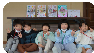
作品と一緒に記念撮影

「冬休み子どもの居場所づくり」(12月25日～1月7日)に町内の小学生9名が参加してくれました。子どもの居場所では、午前中は学習や読書、午後は体育館でボール遊びをしたり囲碁などをして過ごしました。最終日は恒例となっている工作の時間で、紙コップのひな人形を作りました。和柄やキラキラした折り紙の中から着物にするものを選び、お内裏様とお雛様をそれぞれ個性豊かに仕上げました。背景も花などの絵を描いたり折り紙を貼ったりと工夫を凝らしたひな人形が完成しました。冬休みは年末年始のお休みがあり、開所日数は5日間でしたが参加した子ども達からは、「楽しかった」「春休みも参加したい」との声が聞かれました。なによりみんな仲良く過ごせたことが一番だったようです。