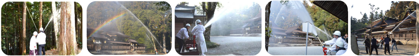
防火訓練の様子(本宮大社)

1月26日(日)の文化財防火デーを控え、熊野本宮大社で1月23日(木)に第71回文化財防火訓練が開催されました。午後3時に宝物殿付近の山林から出火、本殿に燃え移る恐れがあるとの想定で訓練が始まりました。当日は、大社自衛消防隊・田辺消防本部本宮分署・消防団本宮支団が参加し、消火器や放水銃・消火栓を使った消火活動を実施しました。熊野本宮大社の職員は通報と同時に文化財を運び出し、大社自衛消防隊は消火栓を使った初期消火にあたり、出火の通報を受けた本宮消防署員と消防団本宮支団も直ちに宝物殿や社殿への延焼防止のための消火放水活動を行い防火訓練が無事終了しました。今回の訓練を通し地域の大切な文化財を守る意識が、より一層高まりました。