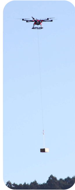
ドローンによる物資運搬の様子

1月18日(土)田辺市防災避難訓練を実施しました。今回は本宮市内の3自治会(上町中村地・上地・本町岩田地)を対象に、田辺市内で震度7の地震が発生したという想定で行いました。避難指示を受けた地域住民が避難所である本宮中学校体育館に避難し、避難所の運営訓練として段ボールベッドの組み立て、簡易テント・簡易トイレの設置等を自主防災組織、自治会、本宮中学校3年生が協力して行いました。屋外では大型ドローンを使用して、うらら館から本宮中学校グラウンドへの物資の運搬訓練が行われました。今回の訓練は、災害に強いまちづくりを推進し、各種災害による人的被害を軽減するため、地域住民が主体となった避難・体験訓練を実地し、地域防災体制の充実強化と防災意識の高揚を図ることを目的に行われたものです。早朝からの訓練にもかかわらず、多くの方々に参加していただきありがとうございました。