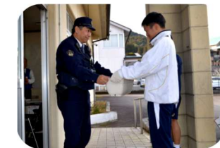
プランター配布（本宮交番様・宝月自動車様）