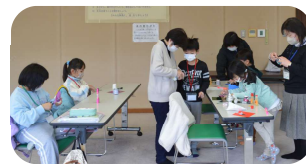
工作に取り組む様子(本宮行政局)

「冬休み子どもの居場所づくり」(12月25日～1月7日)に町内の小学生9名が参加してくれました。子どもの居場所では、午前中は学習や読書、午後は体育館でボール遊びをしたり囲碁などをして過ごしました。最終日は恒例となっている工作の時間で、紙コップのひな人形を作りました。和柄やキラキラした折り紙の中から着物にするものを選び、お内裏様とお雛様をそれぞれ個性豊かに仕上げました。背景も花などの絵を描いたり折り紙を貼ったりと工夫を凝らしたひな人形が完成しました。冬休みは年末年始のお休みがあり、開所日数は5日間でしたが参加した子ども達からは、「楽しかった」「春休みも参加したい」との声が聞かれました。なによりみんな仲良く過ごせたことが一番だったようです。