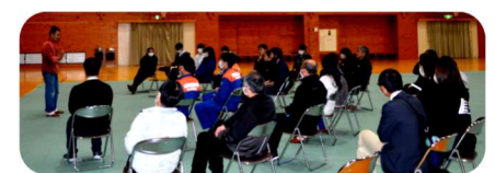
本宮中学校体育館での様子