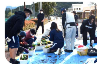
花植え作業（本宮中学校）

※1月号でも紹介しましたが、この取り組みも評価され公益社団法人食品容器環境美化協会が主催する「第25回環境美化教育優良校等表彰事業」の特別賞 協会会長賞を受賞しました。