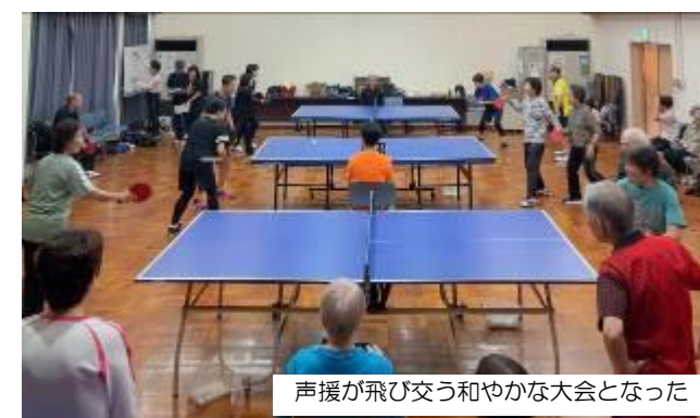
声援が飛び交う和やかな大会となった

軽快な打球音が響く会場で、参加者たちは卓球を楽しみ、互いに交流を深めた様子でした。