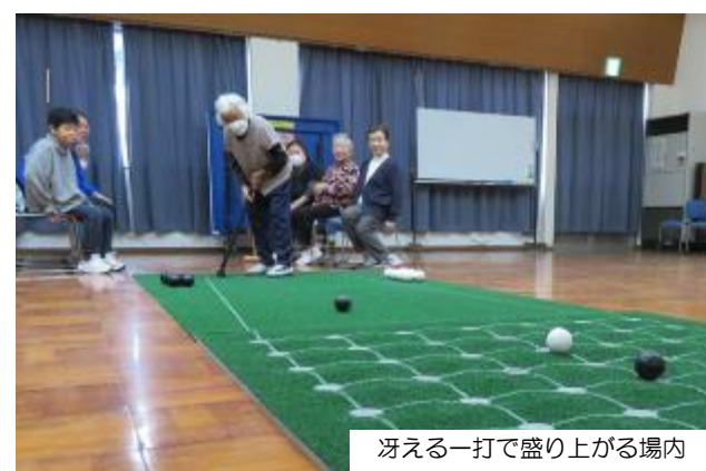
冴える一打で盛り上がる場内

9 名が参加し、ゲームを行いました。 ボールが良いところに転がるたびに歓声が上がリ、終始にぎやかな大会となりました。