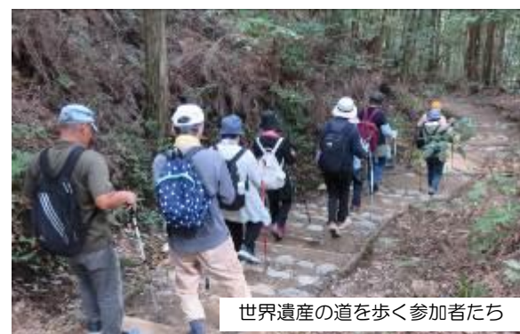
世界遺産の道を歩く参加者たち

10月13日(月・祝)、熊野古道ノルディックウォーキングを開催し、参加者13名が発心門王子から熊野本宮大社旧社地大斎原を目指すルートを歩きました。