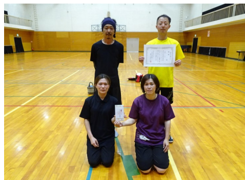
優勝：内ノ井Bチーム