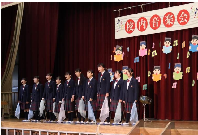
東陽中合唱部のみなさん