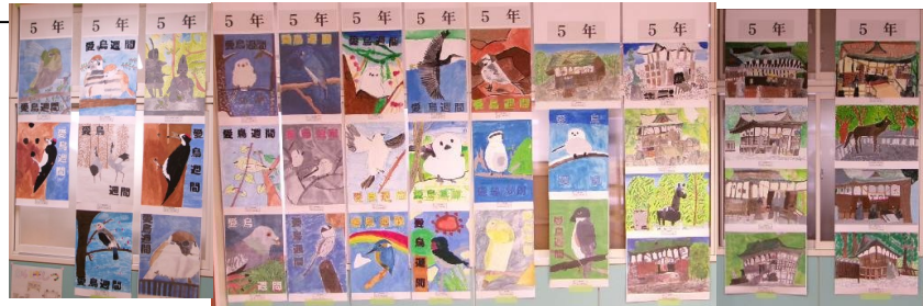
校内絵画展の作品 5年生