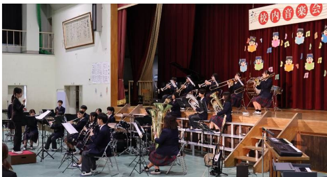
東陽中吹奏楽部のみなさん