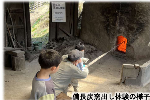
備長炭窯出し体験の様子