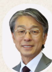
真砂 充敏 氏 (田辺市長)