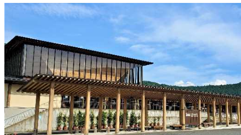
世界遺産熊野本宮館

市ホームページや世界遺産熊野本宮館に企業名を掲示させていただきます（紀州材：あかね材使用）