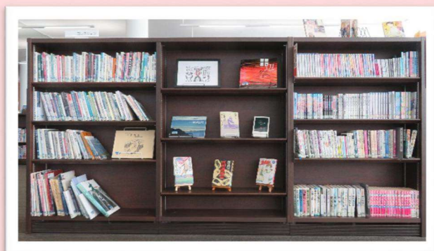
■コレクションコーナー

中高生の皆さんに「ぜひ読んでほしい！」本を集めたYAコーナーと、熊野古道関連図書や田辺市出身の作家による図書を集めたコレクションコーナーが新しくなりました。以前にも増して充実したラインナップとなっていますので、是非ご利用ください！